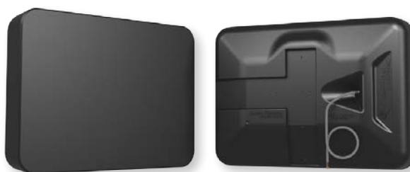
Černá povrchová úprava

Reproduktor Stealth Acoustics StingRay 6™ je hi-fi 6,5" dvoupásmový venkovní reproduktor s plným rozsahem, ochranou proti povětrnostním vlivům, který využívá technologie přední utěsněné vyzařovací plochy krytu bez přítomnosti mřížek nebo jiných otvorů . Reproduktor StingRay 6™ se vyznačuje vyzařovací plochou Fidelity Glass™ patentovanou společností Stealth, která je vyrobena z extrémně odolného a neprostupného skelného vlákna, jež odolá vlivům slané vody, slunečního záření nebo extrémních teplot a přitom bude poskytovat plný a přirozený zvuk pro poslech hudby nebo mluveného slova.